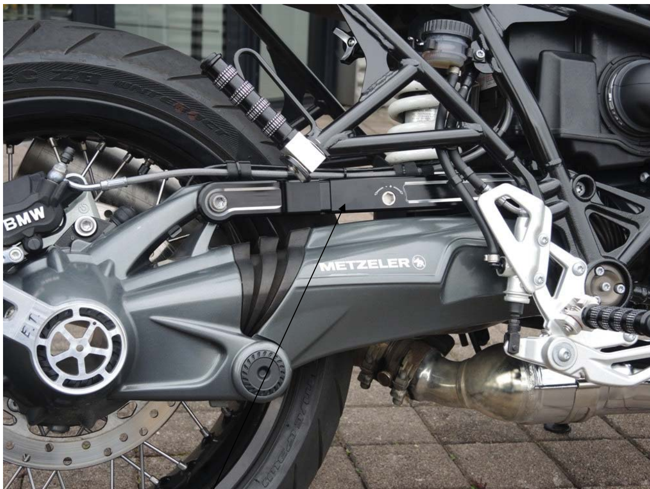
Paraleverstrebe, Typ BM9T